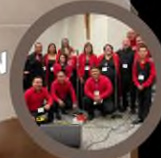
MINISTERIO DE ALABANZA DIÓCESIS DE HARRISBURG, PA CHESED