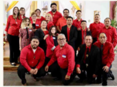
Ministerio Alabanza y Adoración, Chesed Harrisburg

Esta celebrando sus 50 años de compromiso en ayudar a otros a encontrar y conocer a Jesucristo!