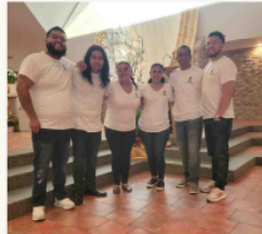
Ministerio GOTAS De Amor, DE

Lugar: San Juan Bautista Church 425 S Duke Street Lancaster, Pa