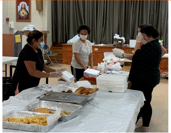
a los Coordinadores de Take-Out/to our Take-Out Coordinators