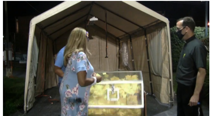
a Nuestros Partidarios de la Rifa / to our Raffle Supporters