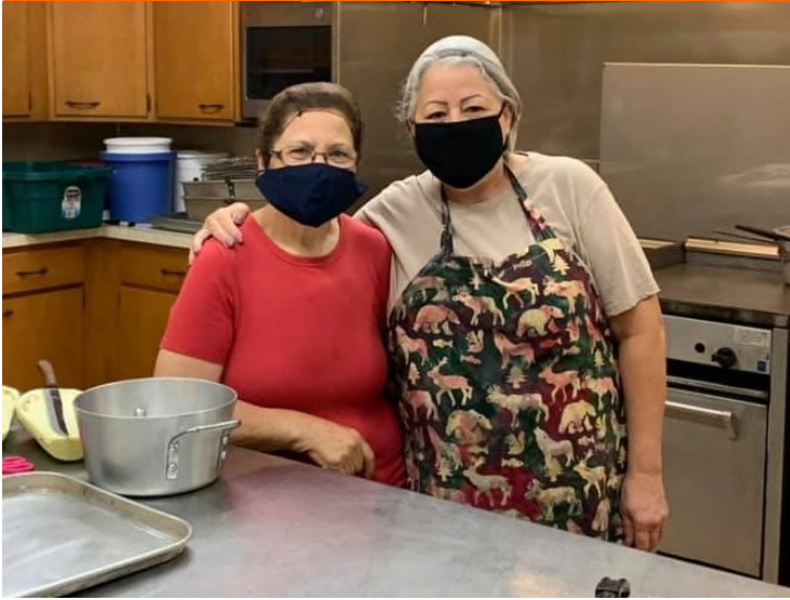
a Nuestros Cocineros Tremendos/ to our Tremendous Cooks