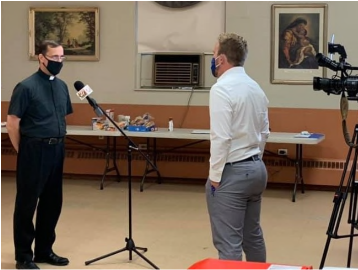
a Nuestros Partidarios en los Medios/to our Media Supporters