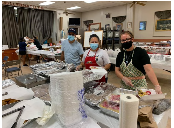
a Nuestros Servidores Comprometidos / to our Servers