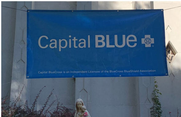
a Nuestros Patrocinadores / to our Generous Sponsors