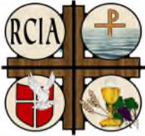
Rite of Christian Initiation for Adults