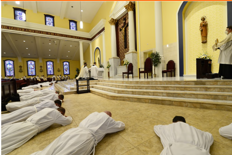
Prostración durante la Letanía de los Santos Prostration during the Litany of Saints