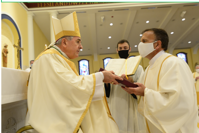
Presentación del Libro de los Evangelios Presentation of the Book of the Gospels