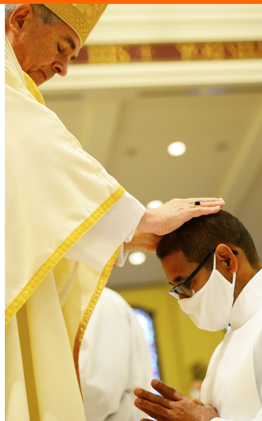
Imposición de las Manos Laying on of Hands