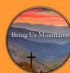
Bring Us Mountains