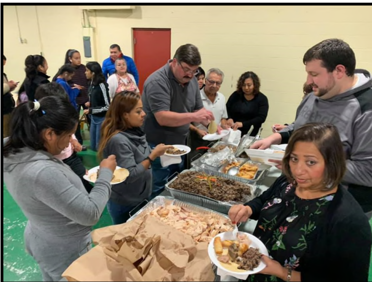
Cena en acción de gracias Festival 2019 Festival 2019 Thank You Dinner