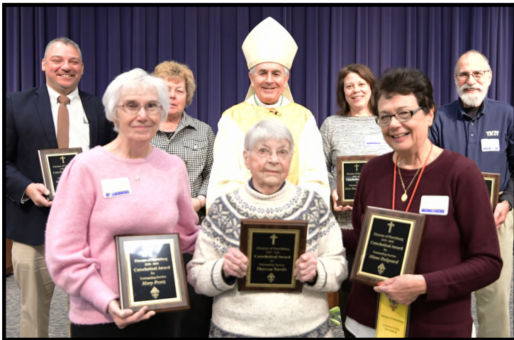
Reconocimientos de Catequistas Catechetical Awards