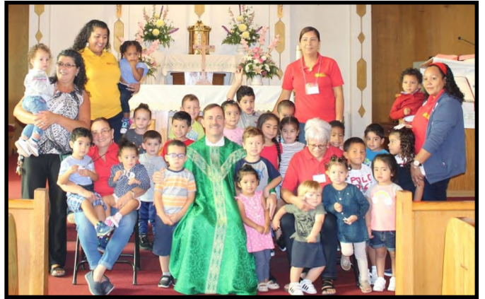
San Juan Bautista Pre-school Aniversario de 15 años / 15 th Year Anniversary