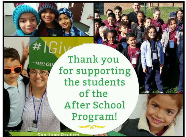
Thank you for supporting the students of the After School Program! Campaña de Extra Ordinary Give Extra Ordinary Give Campaign