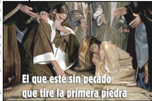
El que esté sin pecado que tire la primera piedra

On this Fifth Sunday of Lent, the beginning of our last week before Holy Week, our attention turns toward the Cross, a turning marked by the covering of the crosses and statues in purple. On Ash Wednesday, we received an ashen cross to initiate our Lenten journey and motivate a deepening conversion. This Lenten renewal flows from the Crucified One, who came