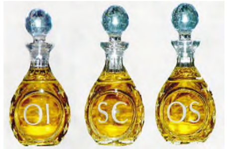
SANTOS ÓLEOS Óleo de los Catecúmenos El Santo Crisma El Óleo de los Enfermos

En la noche del Sábado de Gloria, la Iglesia celebra la Resurrección del Señor, en la primera y más importante Misa de Pascua y del año, en la Vigilia Pascual. Comenzando a las 8:00 PM., nuestra comunidad se reunirá en la Vigilia Pascual para experimentar el poder, la gloria y alegría de la Resurrección. La parte central de esta vigilia es la Nueva Vida del Señor Resucitado que El comparte con nosotros en los Sacramentos. Comenzando afuera en la oscuridad, se enciende el Fuego Pascual; se bendice el Cirio Pascual y se enciende la vela con fuego nuevo. Mientras la congregación es guiada dentro de la iglesia por la luz del Cirio Pascual, cada uno proclamamos a Cristo como nuestra Luz recibiendo una vela encendida. En esta hermosa vigilia, las Sagradas Escrituras explican el plan de Dios para nuestra salvación. Entonces esos que se han preparado a través de los estudios y oración para convertirse en católicos pasan al frente para recibir los sacramentos de Bautismo, Confirmación y Primera Comunión. Por consiguiente, el Señor Resucitado está presente en la Vigilia, no sólo a través de Su Palabra y en la Eucaristía, sino también a través de los nuevos hijos de Dios a través del agua y el Espíritu Santo.