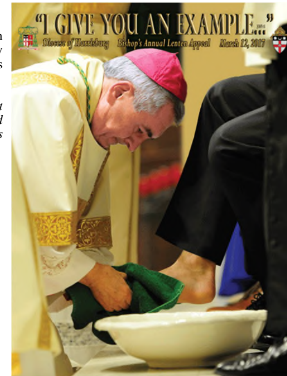
APELO CUARESIMAL — DISTRIBUCION DE FONDOS