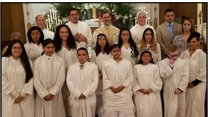
Recién bautizados y confirmados durante la Vigilia Pascual Easter Vigil Newly Baptized & Confirmed