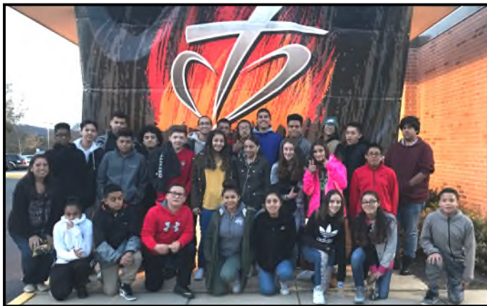
Jóvenes en el Retiro "Fan the Fire" en York, PA Youth at Fan the Fire Rally in York, PA