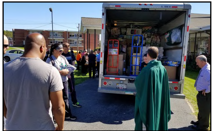
Generosa Respuesta a los Esfuerzos de Socorro de Puerto Rico Generous Response to Puerto Rico Relief Efforts