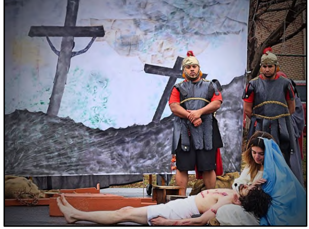
Cristo es Clavado en la Cruz / Cristo en los brazos de Su Madre Christ is Nailed to the Cross / Christ is his Mother's Arms