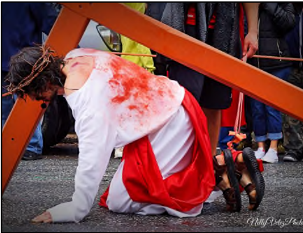
Nuestros niños y la multitud siguen a Cristo / Cristo cae Our Children and the Crowd follow Christ / Christ falls