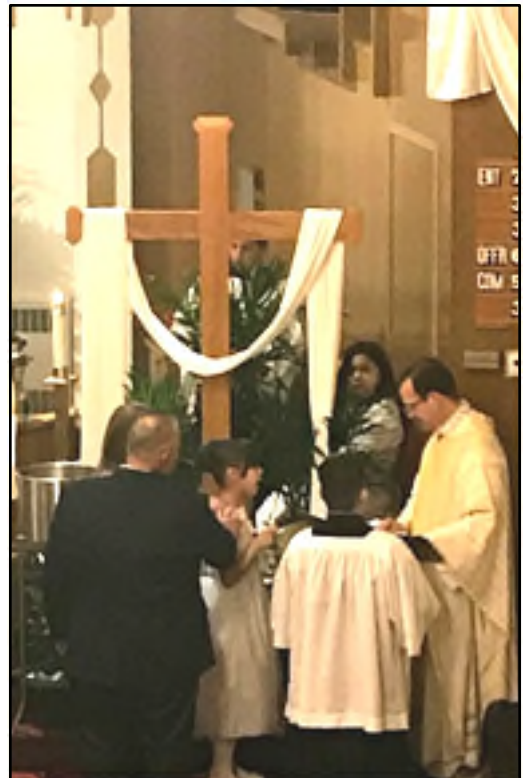
Nueva Vida brota de la Fuente Bautismal New Life flows from the Baptismal Font