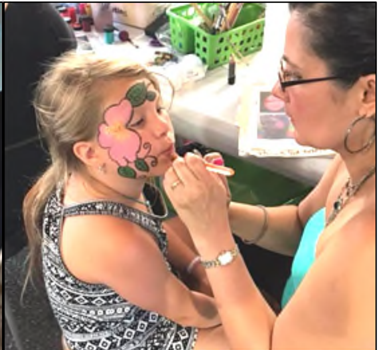
Los niños disfrutaron de nuestro Festival Hispano Our children enjoy our Hispanic Festival