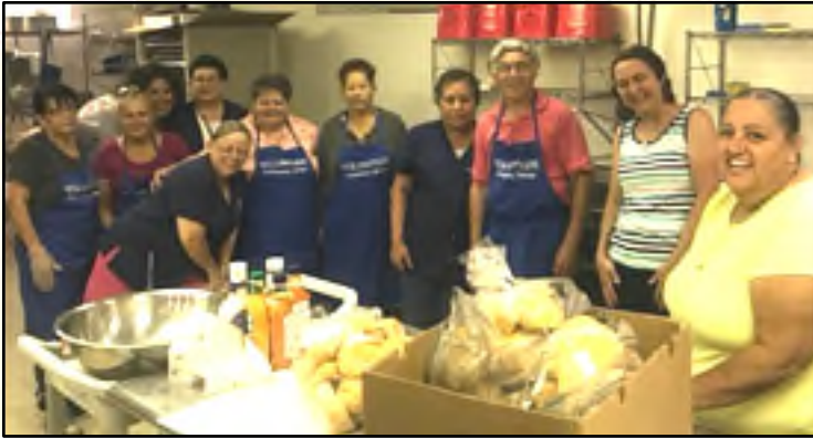
Grupo de Voluntarios preparan Comida para los Necesitados Group of Volunteers at the Community Meal for the Needy