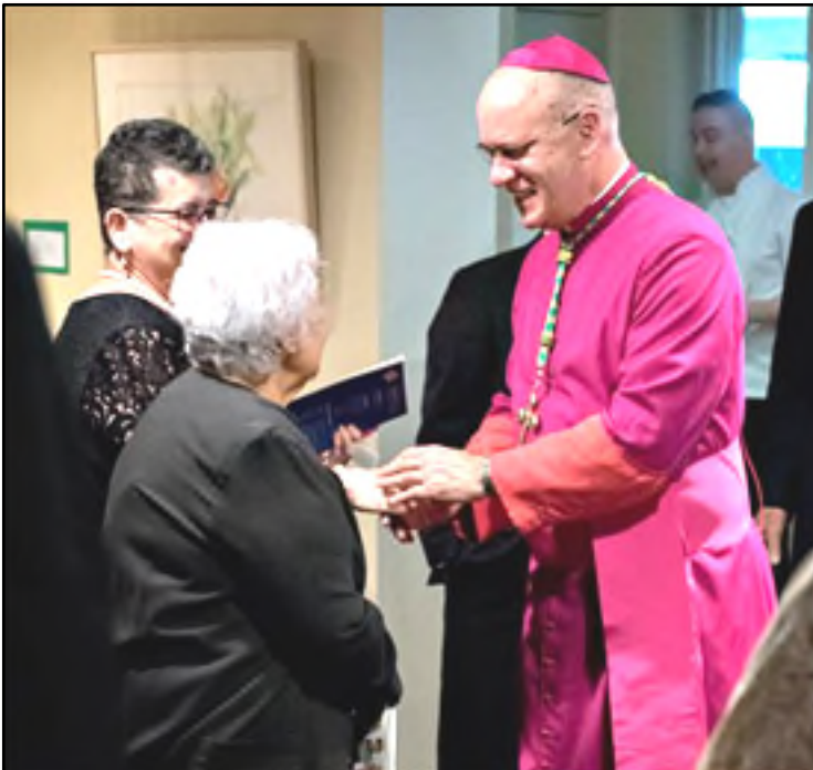
Bishop Rhoades saluda a invitados en nuestra Gala de Fe Bishop Rhoades greets invitees at Our Gala de Fe