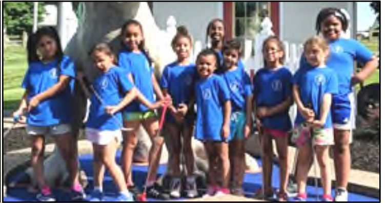
Grupo de niñas participaron de nuestro Campamento de Verano Group of girls enjoy Miniature Golf during our Summer Camp