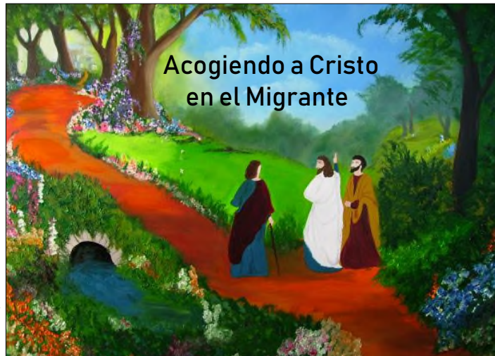
Acogiendo a Cristo en el Migrante